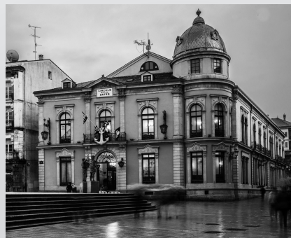
CIRCULO DE LAS ARTES