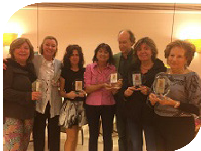
Las Campeonas en la edición 2014.