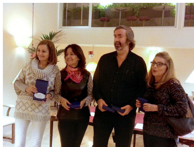
Equipo Las Chicas de Paco