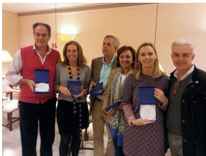
Equipo Aquí hay Tomate