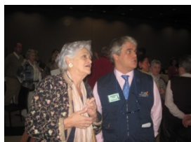
La presidenta de la AEB con el director del torneo