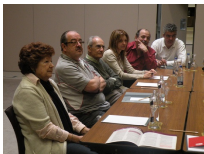
Atentos asistentes a las charlas sobre reglamento impartidas por los árbitros