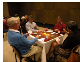
Los campeones de parejas mixtas y de categoría corazón